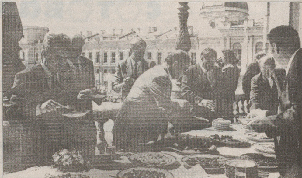
Фото №5: о чем могут беседовать участники экономического форума?

Напоминаем, что с номера №41 мы начали среди читателей нашей газеты конкурс на лучшую подпись к фотографии. Условия простые: в каждом номере мы публикуем специальную фотографию, к которой вы должны придумать оригинальную подпись НА ТЕМУ ПОДПИСКИ. Мы ждем ваших звонков со дня выхода номера газеты до вторника следующей недели. Победители получают призы.